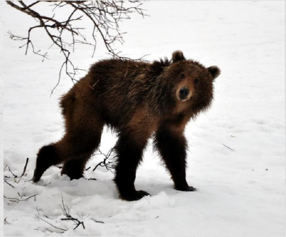
Медведь после спячки