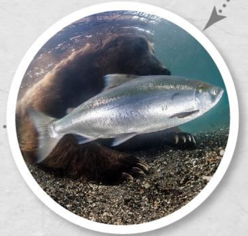
Серебрянка (взрослая в океане)