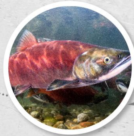
В брачном наряде (нерест)