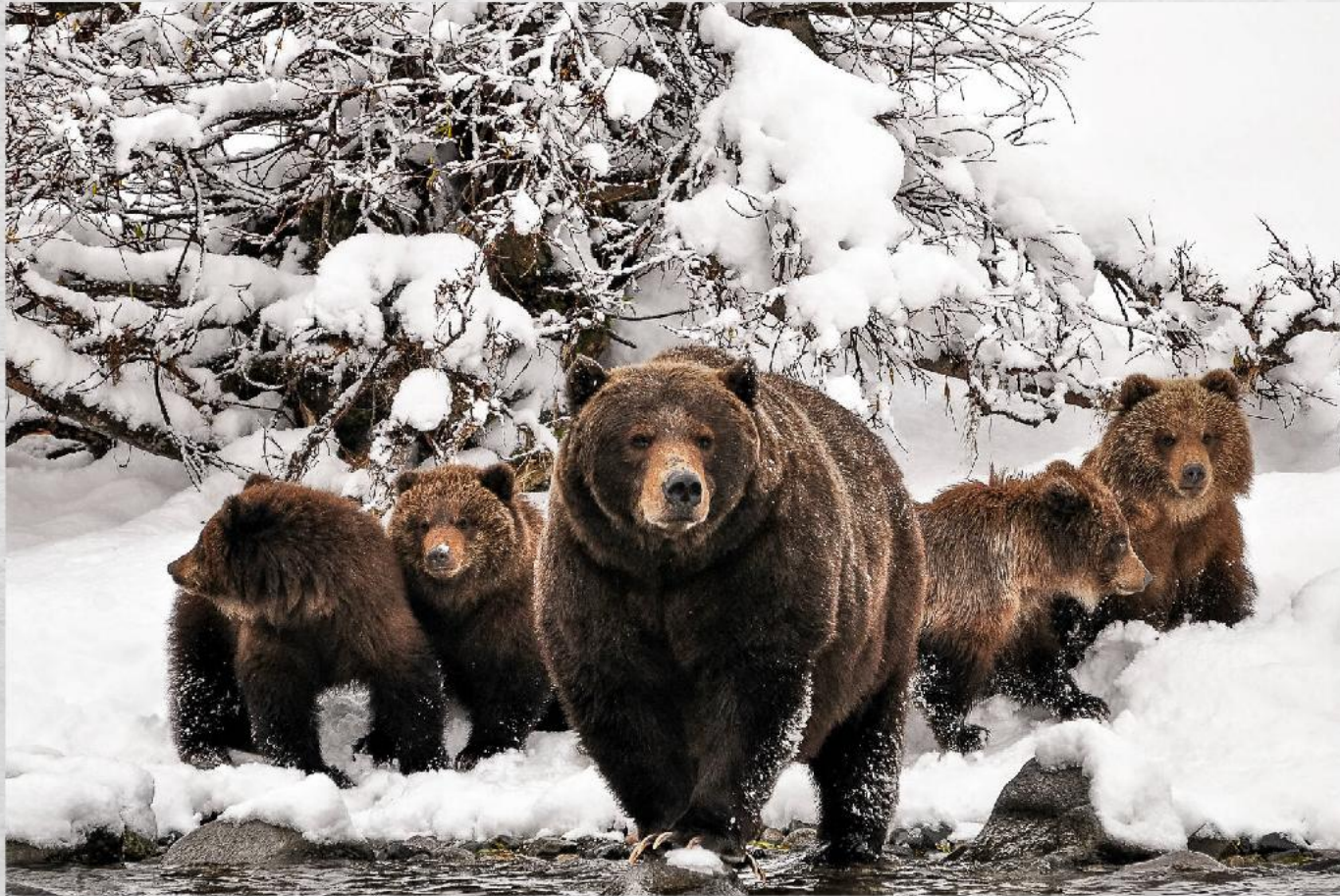
Ноябрь. Мишки в длинной и густой шерсти